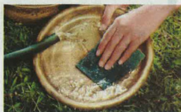
●在清洗水盆时，记得用清水和肥皂冲洗，同时用刷子刷清水盆内部，以确保蚊子的卵被清除掉。