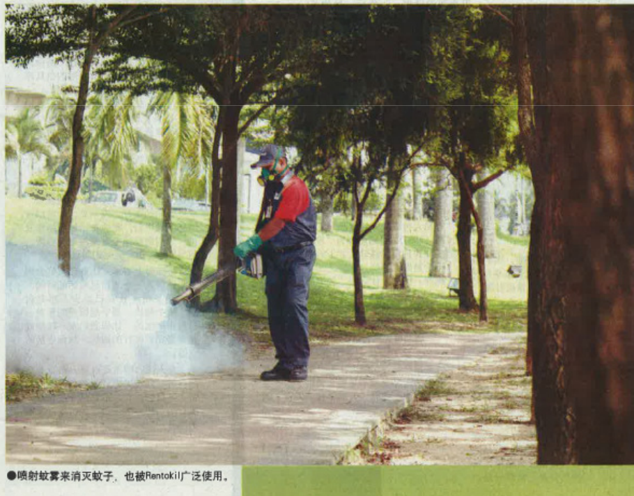
●喷射蚊雾来消灭蚊子，也被Rentokil广泛使用。