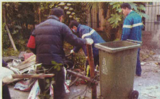
●灭蚊最有效的方案是需要整个住宅区的合作，以保持住宅区的卫生，尤其是清理并去除蚊子易滋生的地方。比方说，清理花园环境的垃圾。