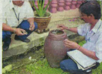
●注入消灭了蚊子的容器如水槽、水盆、容器等，是普遍使用的化学杀蚊方法。