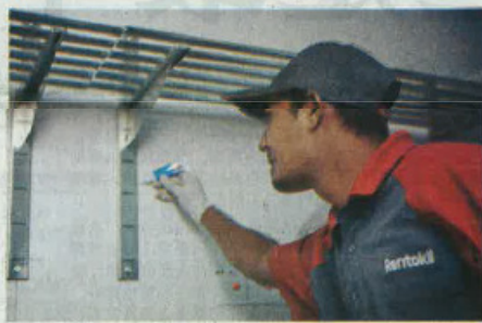
●Rentokil其中一项蟑螂防治方案是胶饵。胶饵对蟑螂而言湿润可口，持效期很长，安全高效方便，并在蟑螂中互相传播毒性，造成蟑螂的群体死亡。

蟑螂有咀嚼式的口器，能啃吃东西。其食物非常复杂，从普通食品到擦鞋的刷子都可以成为它的食物，还有电线胶皮、硬纸板、肥皂、枯叶、纺织品、皮革等等。有时候蟑螂还会去啃书脊里面的浆糊，把书咬破，它还吃粪便、痰液和小动物的尸体。