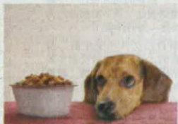
●若家有饲养宠物，切记妥善贮存食物，饲喂宠物后彻底清理食物残渣。

●古晋Rentokil分行拥有经验丰富及专业的执照服务技术人员，配备齐全，可以确保所使用的化学药物安全性和最终效果。