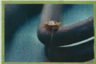
●蟑螂有咀嚼式的口器，能啃吃东西，蟑螂的食物非常复杂，从普通食品到擦鞋的刷子都可以成为它的食物。

记者日前走访及咨询Rentokil灭虫服务公司，他们以专业与经验，与我们一起探讨预防及对治害虫之课题，从中开启我们对防治害虫的认知。