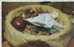
●要消灭蟑螂，时时打扫包括卫生间和下水道，垃圾要即时清理。